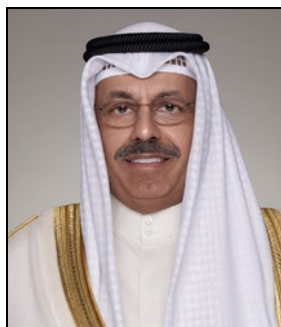
เชค อะห์มัด นะวาฟ อัลอะห์มัด อาลเศาะบาห์ (His Highness Sheikh Ahmad Nawaf Al-Ahmad Al-Sabah)