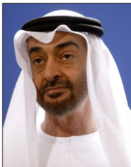
เชค มุฮัมมัด บิน ซายิด อาลนะห์ยาน (His Highness Sheikh Mohamed bin Zayed Al Nahyan)